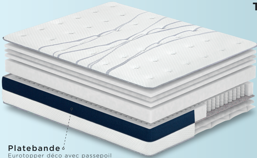
Platebande Eurotopper déco avec passepoil